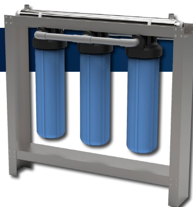
UV-50BB-3-R WATER PURIFICATION SYSTEM